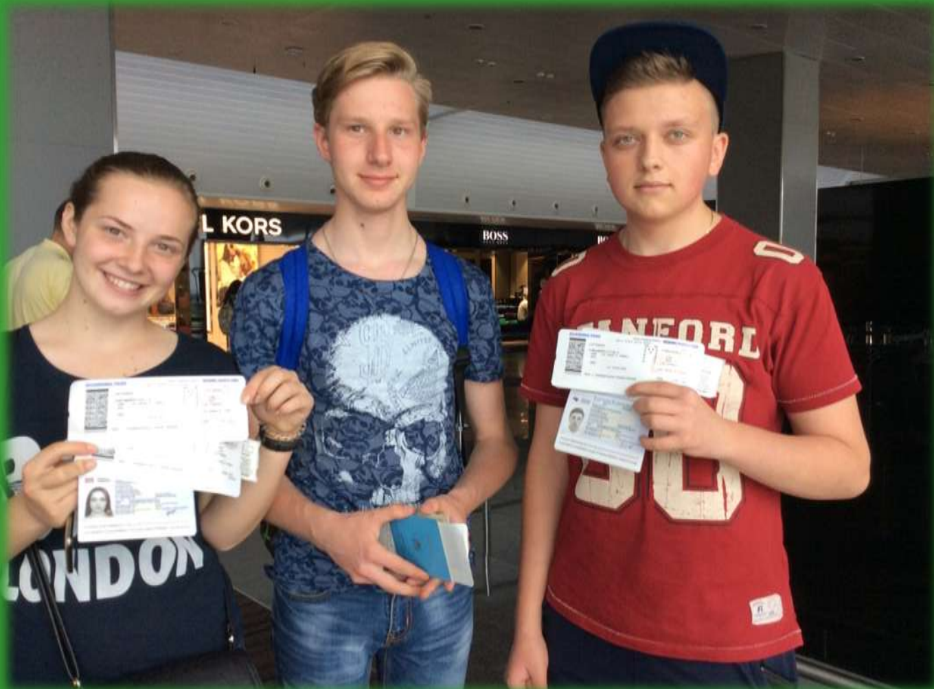
30.05.2016 Либенау, первый рабочий день Международной молодежной встречи (участники из 4 стран, Украины, Беларуси, Польши, Германии, 49 участников)